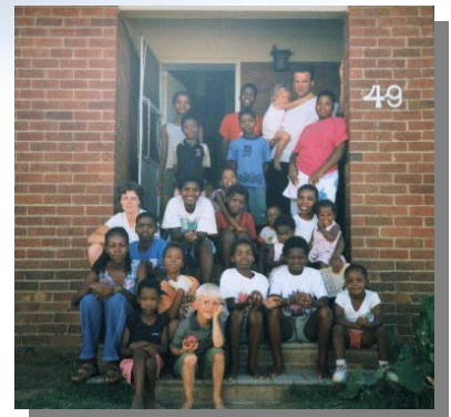
Hier de kinderen van het kindhous met een aantal hollandse gasten

Dat geeft energie om door te gaan met dit werk...'