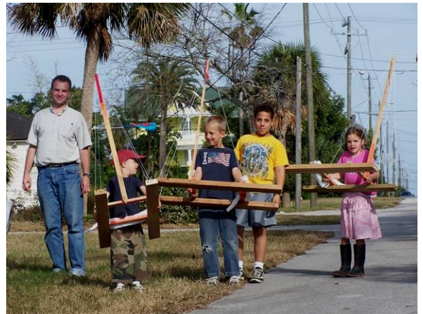
In de vakantie hebben we drie boten gemaakt van afvalmateriaal en ze varen goed!

GPS aan de beurt. Voor iedere landing moet de GPS geprogrammeerd worden. Nu was het even zweten, want ik deed niet exact wat de GPS wilde. Dus nu wordt het probleemoplossen in plaats van programmeren. En gelukkig was het probleem op tijd opgelost. Alleen vergat ik hierdoor iets anders te doen wat je altijd moet doen tijdens GPS vliegen. Dus was ik niet geslaagd. De inspecteur raadde me aan om verder te gaan met het examen omdat het andere allemaal goed gaat. Er volgen nog twee toenaderingen naar een ander vliegveld en na bijna 3 uur vliegen landden we veilig op Daytona Beach. Vijf dagen later heeft de inspecteur tijd om nog een keer met me te vliegen en dat spreken we dan af. De volgende vlucht verloopt uitstekend en krijg ik het fel begeerde papiertje!